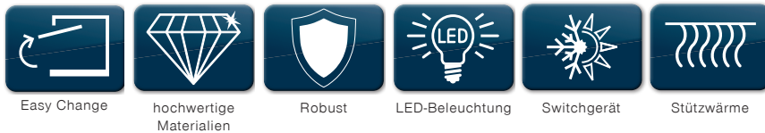
Easy Change hochwertige Materialien Robust LED-Beleuchtung Switchgerät Stützwärme

Sie passt die Temperatur dem gewünschten Angebot an und setzt Waren auch im Neutralbetrieb attraktiv in Szene. Ob Bedienung, Selbstbedienung oder Grab-and-Go: Die Einsatzmöglichkeiten während der Öffnungszeiten lassen speziell bei knappen Raumverhältnissen kaum Wünsche offen.